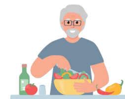
Activités de la vie quotidienne et loisirs